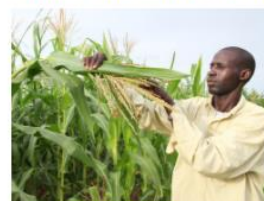
Local capacities benefit rural communities in Mali